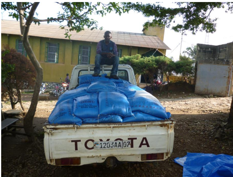
Een landcruiser volgeladen met rijst, bonen, zeep en zout voor distributie onder ontheemden buiten de stad Bunia.