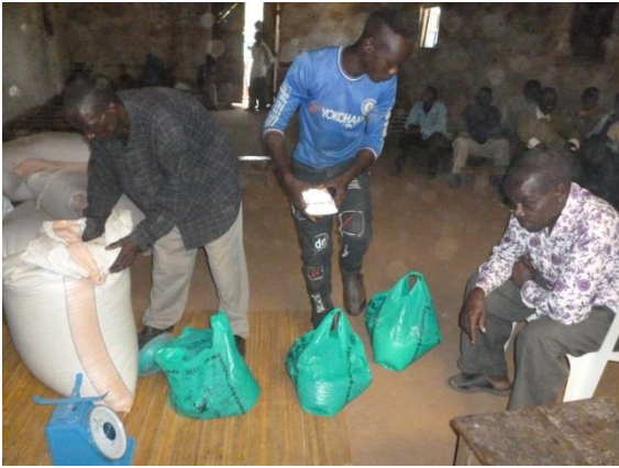
7 kg bonen per persoon.