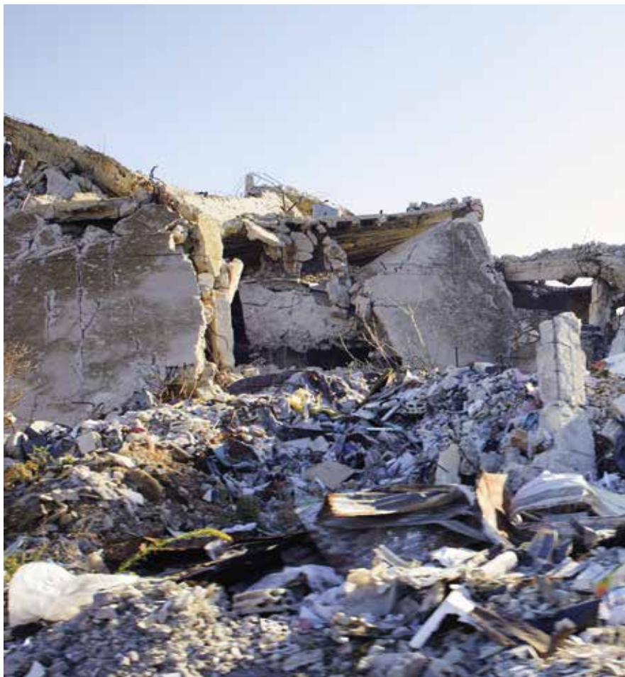
Delen van Homs zijn door de oorlog totaal verwoest.