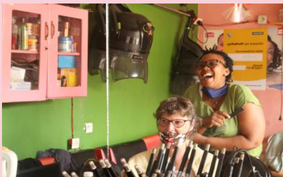
Kijk eens wat vaker in de spiegel van de kapper

Ik besluit haar die kans te geven. Wat is ze trots als ik bij haar de kapsalon binnenstap. Normaal gesproken gaan blanken naar goed opgeleide Engelssprekende kappers. Ze haalt letterlijk alles uit de kast om mijn haar zo goed mogelijk te knippen. Het is een hele kunst om het wat krullende gladde haar van een blanke vrouw te knippen. Uren later verlaat ik blij en dankbaar de kapsalon, wetend dat ik een bijdrage heb geleverd aan het betalen van de hoge huishuur of het schoolgeld van haar kinderen. En de volgende keer ga ik gewoon weer.