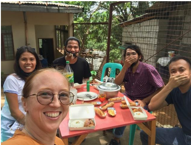
Samar team debrief

De dag voor mijn vertrek, kon ik nog net het Samar team ontmoeten, van wie de quarantaine periode afgelopen was. Het gebied waar ze wonen maakt deel uit van Manila, waar ik via een verlaten steenmijn naar toe moest. Onverharde weg omhoog met overal putten en stenen. Het was een rare gewaarwording dat dit soort plekken bestaan in de miljoenen stad Manila. Maar een heerlijke laatste reisje met de motor. Het was goed met hen even terug te kijken op hun jaar in Samar en de rare reis terug... de buurman in de sloppenwijk is een kok, die nu geen werk heeft... hierdoor hadden we heerlijk eten van restaurantkwaliteit in de sloppenwijk :-).