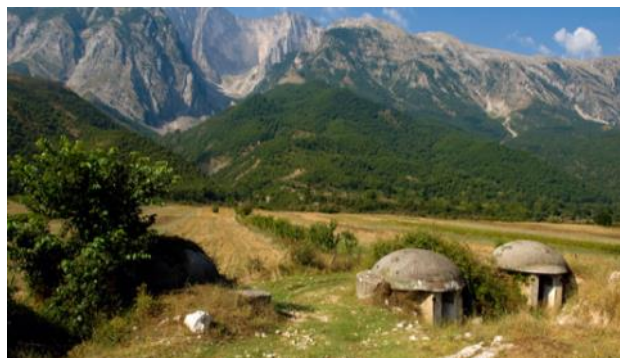
In Albanië staan nog steeds bunkertjes

We willen tijdens ons werk en verblijf in Albanië graag ontdekken wat wij (en de Nederlandse kerken) kunnen leren van de Albanese als het gaat om de relevantie van het christelijk geloof in een multi-religieuze samenleving.