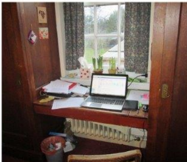
Eind maart sloot ik het theorie gedeelte van mijn MA studie in Engeland succesvol af.