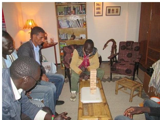
De trainers bij mij op bezoek

Inmiddels ben ik alweer twee weken op pad geweest naar Gilgil Beles om 40 Gumuz-leerkrachten en 6 schoolinspecteurs te trainen. Een week ervoor kwamen de Gumuz-moedertaaltrainer en drie collega's naar Addis om de training samen voor te bereiden. De taalboeken voor de eerste en tweede klas van de basisschool zijn nu geïntroduceerd en de leerkrachten hebben geoefend om de lessen te geven volgens de instructies in de handleiding. Dat is nog steeds een hele klus voor ze. Ze zijn zo gewend aan voorzeggen, nazeggen en uit het hoofd leren. Bovendien vinden ze zelf het lezen in hun eigen taal nog niet makkelijk.