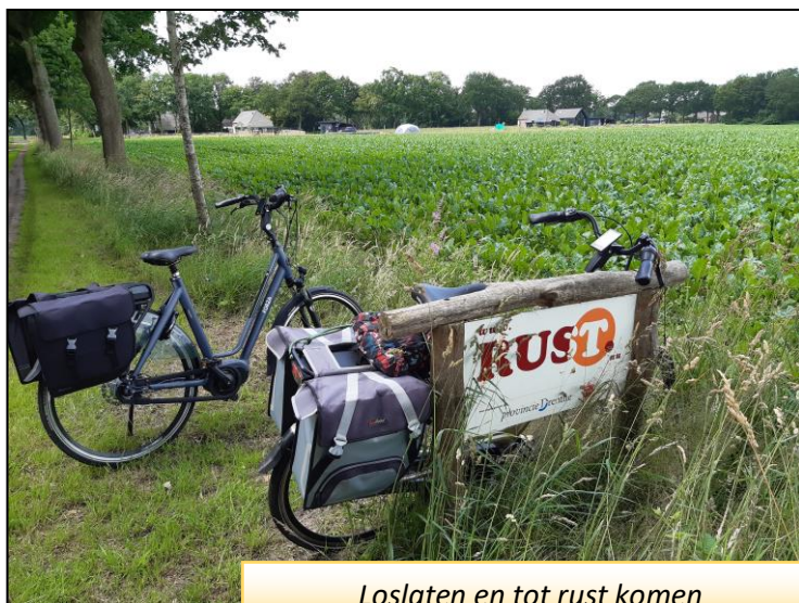
Loslaten en tot rust komen

Mijn collega in Addis is nog steeds in overleg en hoopt dat er toch nog toestemming komt. Ik ging ondertussen door met de twee taalteams en nu zijn in ieder geval de verhalen en liedjes voor het eerste kleuterschooljaar geschreven. Maar sinds eind augustus is het programma toch stilgezet. Ik heb aangegeven dat ik het werk nu graag wil overdragen. Ik wilde graag nog mijn bijdrage leveren maar de tijd is voorbij om de verantwoordelijkheid voor een heel tweejarig kleuterschoolprogramma op me te nemen.