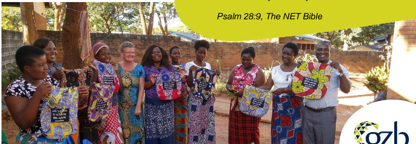
Rond ons afscheid konden we veel tasjes uitdelen: aan alle collega's in het ziekenhuis, in het dorp Luhomero en (zoals hier) tijdens de 'afternoon prayer'.