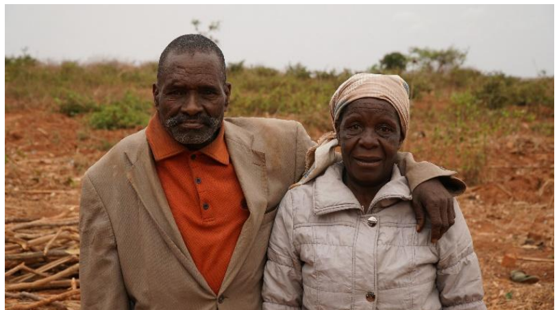
Mooie mensen in Noord-Malawi