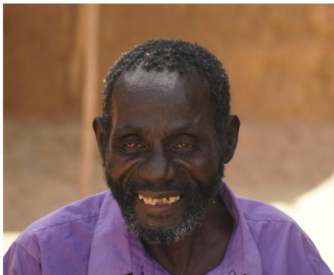
Gebed voor patiënten palliatieve zorg