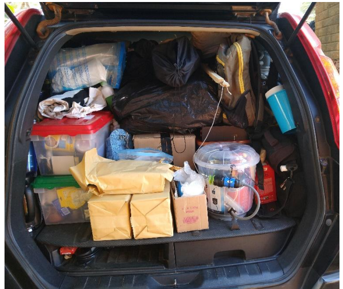
De auto van Abraham