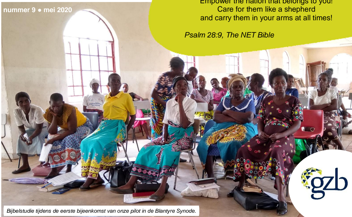
Bijbelstudie tijdens de eerste bijeenkomst van onze pilot in de Blantyre Synode.